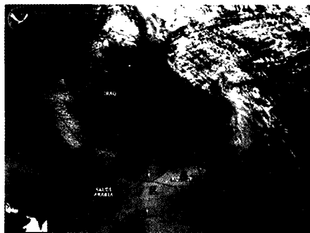
图 2 NOAA 16 于 3 月 27 日 10 时 27 分(世界时)监测到沙尘暴移出伊拉克境内图像

美军利用气象卫星监测和分析资料,及时调整作战计划,暂时停止 3 月 25 ~ 26 日的进攻态势,在 3 月 27 日沙尘暴移出战区后(如图 2 所示)才恢复了全面进攻行动。而伊拉克军队,由于无气象卫星的技术保障,丧失了 3 月 24 ~ 27 日的有利战机,没有组织有效的反击。